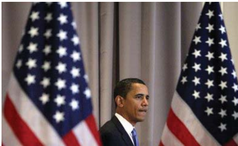
Prezydent elekt, Barak Obama