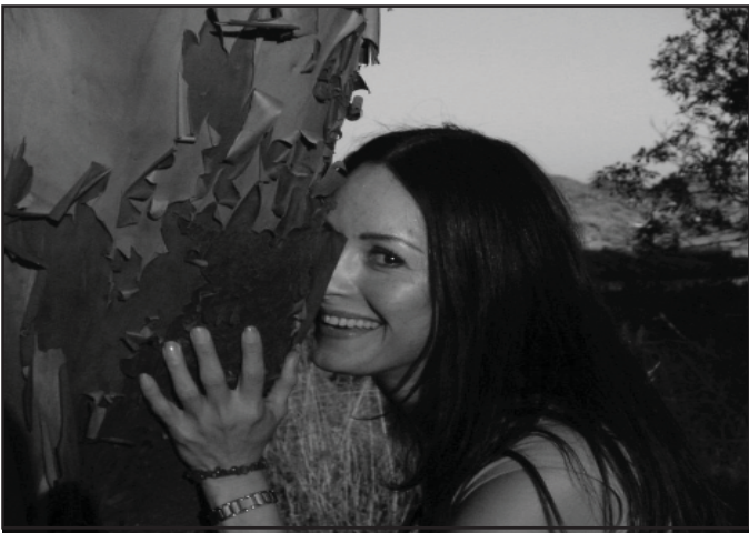
Dziewczyna z Wyspy