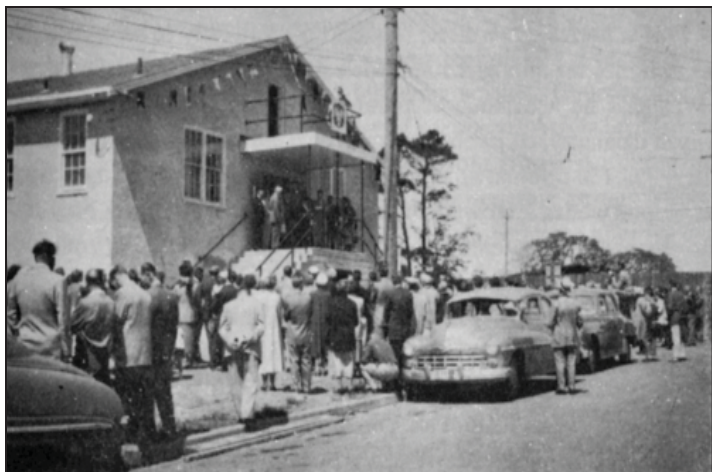
Otwarcie Domu Polskiego w Victorii. Maj 1954.

Fragment z Książki Polacy w „Brytyjskiej Kolumbii”. Wyd. Warta 1988.