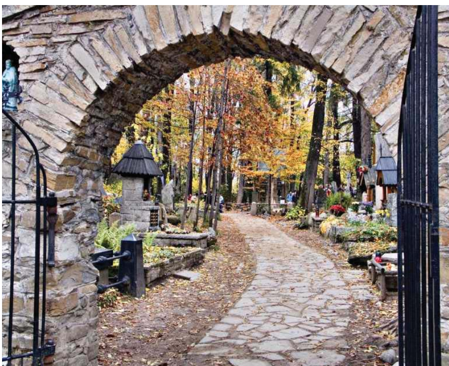
Brama Cmentarza na Pęksowym Brzysku w Zakopanem

miejscem narodowego kultu. Nawet podczas największej niewoli Polacy mogli gromadnie wylegać na cmentarze. U grobów polskich królów, narodowych bohaterów, powstańców, ofiar przemocy i terroru okupantów odbywały się wówczas masowe manifestacje narodowej przynależności o charakterze religijno-patriotycznym. Te groby, jak na przykład jeden z