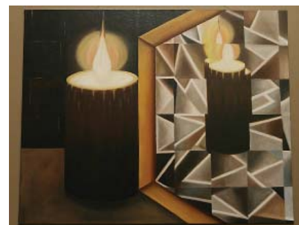
Baśniowy świat Wiesi Godek