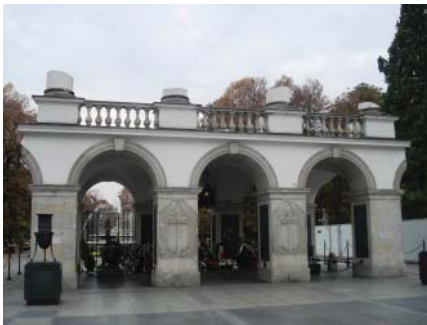
Grób Nieznanego Żołnierza