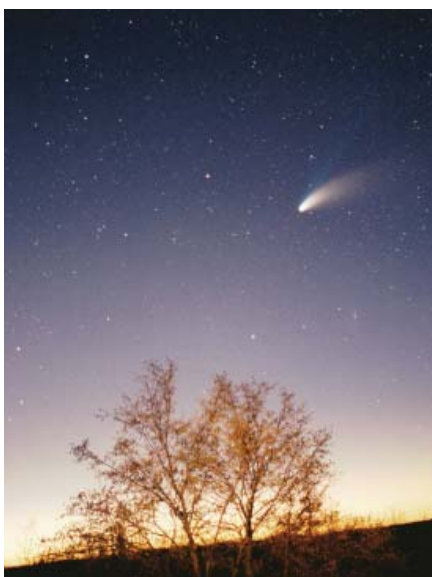
Kometa Hale Bopp

Nade wszystko dreszcz emocji miały budzić doniesienia o