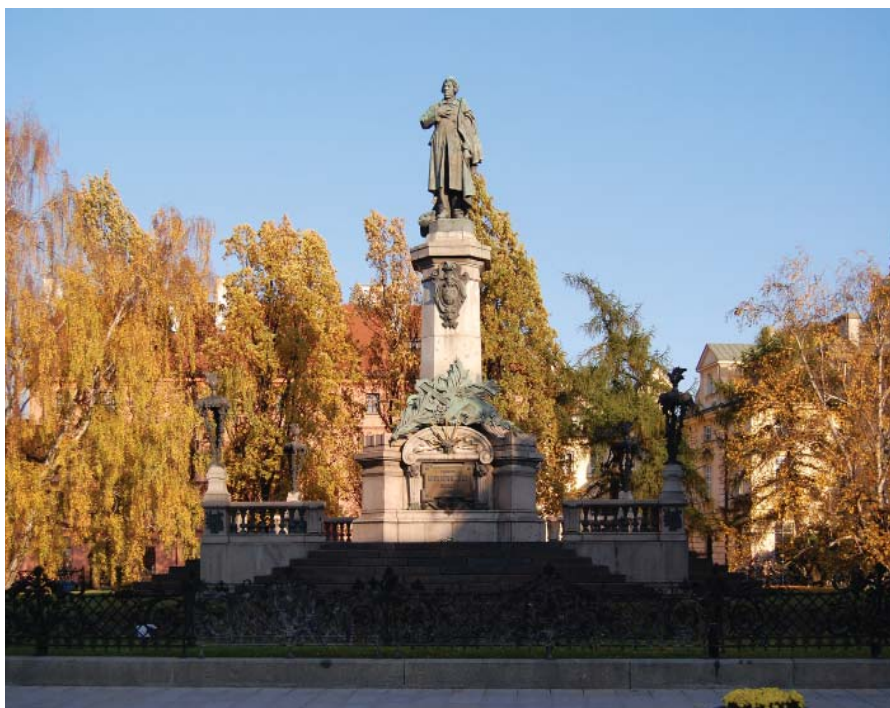
Pomnik Adama Mickiewicza w Warszawie