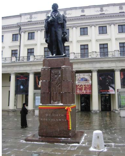
Wojciech Bogusławski na cokole

Pomnik innego wielkiego Polaka - Wojciecha Bogusławskiego . Został wysadzony w powietrze w 1944, a brązowe szczątki figury znaleziono na terenie fabryki Lilpopa. Po wojnie odtworzony został przez Jana Szczepkowskiego, autora przedwojennej rzeźby i odsłonięty 17 stycznia 1965 r., niestety już po śmierci Szczepkowskiego. Artysta nie doczekał też odsłonięcia pomnika Stanisława Moniuszki . Pracował nad nim po wojnie, choć zamysł wcześniejszy bo z 1932, wedle którego dwaj twórcy teatru i opery narodowej mieli stanąć na pl. Teatralnym. Jako model do wykonania samej figury pozował Szczepkowskiemu Józef Korolkiewicz – znany polski baryton i malarz. Pomnik odsłonięty został w dniu inauguracji działalności Teatru Wielkiego, po odbudowie z wojennych zniszczeń, dnia 19 listopada 1965 r., a wieczorem,