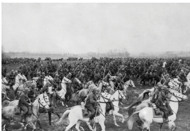
Polska kawaleria w kampanii Wrześniowej 1939

Śluchali radia i wierzyli w rychłą pomoc ze strony Francji i Anglii i szybkie zwycięstwo. Tymczasem w dwa tygodnie po napadzie Niemców, 16 września Polska została zaatakowana przez Rosję Sowiecką. Wynikiem tej agresji były wywózki na Sybir, całymi rodzinami, wielu